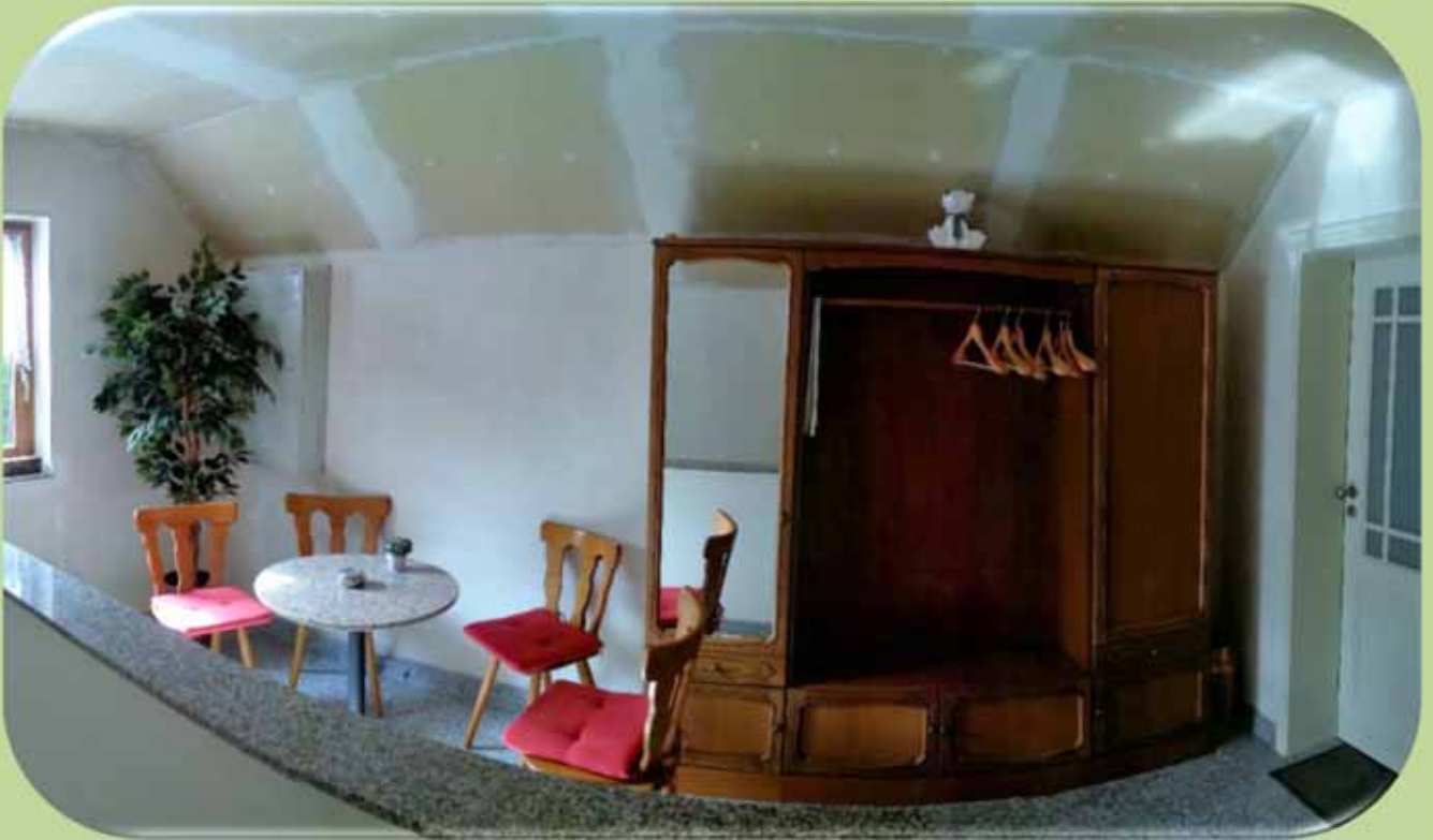
Garderobenschrank und kleiner Raucherecke