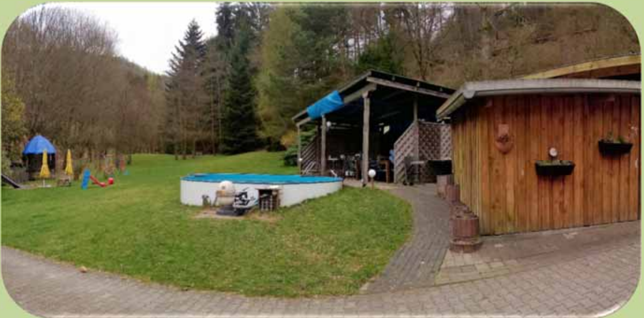
Platz für 12 Personen mit Grillmöglichkeit

Spielgeräte und Pool gehören aus rechtlichen Gründen nicht zur FeWo dazu.